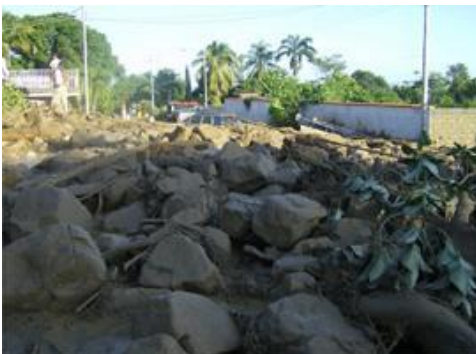
Juli 2009: Venezuela: zomer-groepsproject-reis incl. Spaans & activiteiten

Tijdens de Wereldhulpweken.nl gaat in de zomer (06 juli t/m 02 aug) een grote groep van internationale vrijwilligers het dorp Playa Colorada helpen. Op 21 september 2007 werd dit dorp getroffen door een aardverschuiving. Na zware regenval bedekte een grote laag modder en rotsen het kleine vissersdorp. Zo'n 60 huizen (vooral van de armere bewoners) werden verwoest. Een groot deel van het dorp moest opnieuw opgebouwd worden. Doel van deze projectreis is dat er in de heuvels boven het dorp nieuwe bossen aangeplant worden. Op deze manier wordt erosie tegen gegaan en kunnen dergelijke rampen in de toekomst hopelijk voorkomen worden. Naast het werk heb je Spaanse les en ga je zeekajakken, klimmen en abseilen in een waterval.